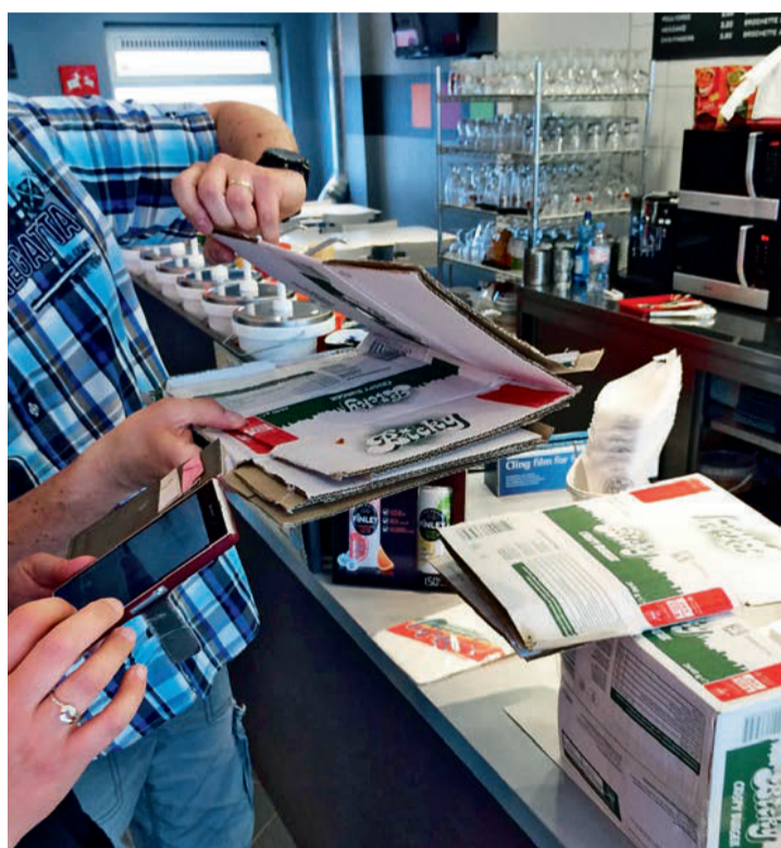
Een snackbareigenaar scant een stapel Bicky-dozen.