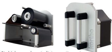
Stabiele en robuuste lint cassette met unieke Pick-off spoel.